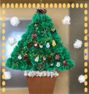
クリスマスへの飾り付け