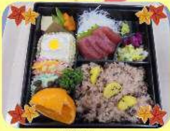
重箱メニュー 栗おこわ お刺身・お煮しめ