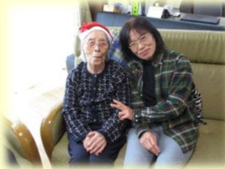
今日は私がサンタクロース♪