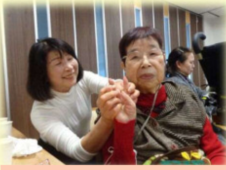
お嫁さんとツーショット