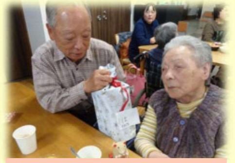
お母さん、当たったよ！