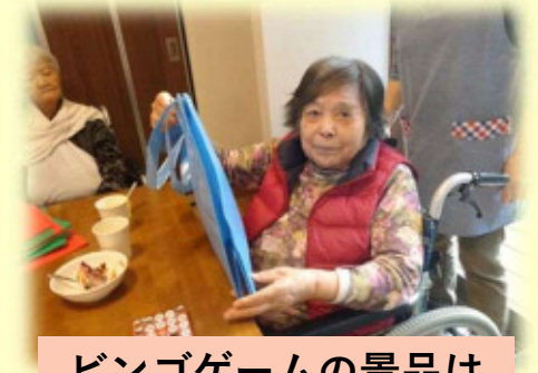
ビンゴゲームの景品は 何だろうかね～