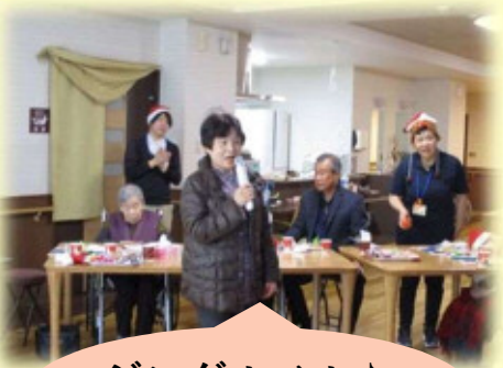
ジングルベル♪ ジングルベル♪