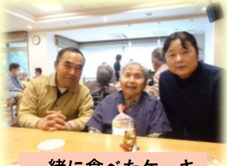
一緒に食べたケーキ 美味しかった～