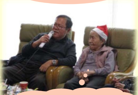
息子の歌声はよかね～

デザートバイキングを楽しみながら、 ビンゴ大会やカラオケ、副苑長が演奏する ハンドベルに合わせてみんなで歌い、 クリスマスを満喫していただきました☆ ご家族の参加 ありがとうございます!!