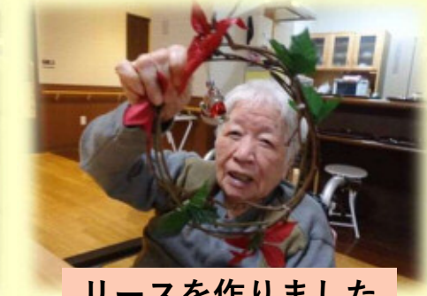
リースを作りました 上手でしょ♪